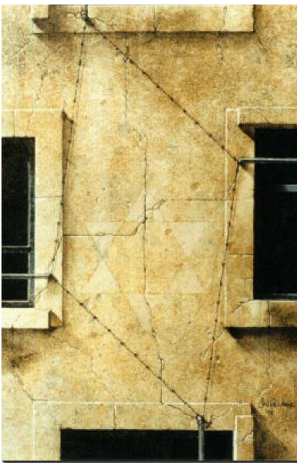
Un regard du peintre John Parlane sur le camp de Rivesaltes