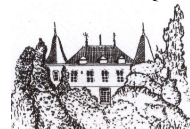
Mairie de Montalzat